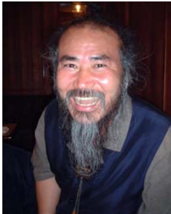
El señor Park, Importante Propiedad Cultural Intangible n.º 108 del gobierno coreano (no, no es coña).

fotografías del impresionante paisaje (para entonces ya había anochecido).